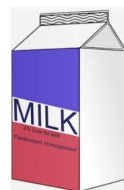
Obr. č. 1:

https://pixabay.com/vectors/alphabet-word-images-beverage-1295664/